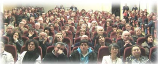
Une partie du public pendant une conférence