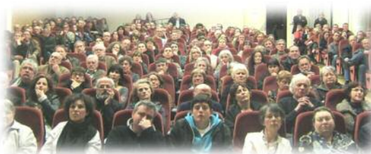
Une partie du public pendant une conférence